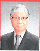
本保 芳明 UNWTO 駐日事務所代表