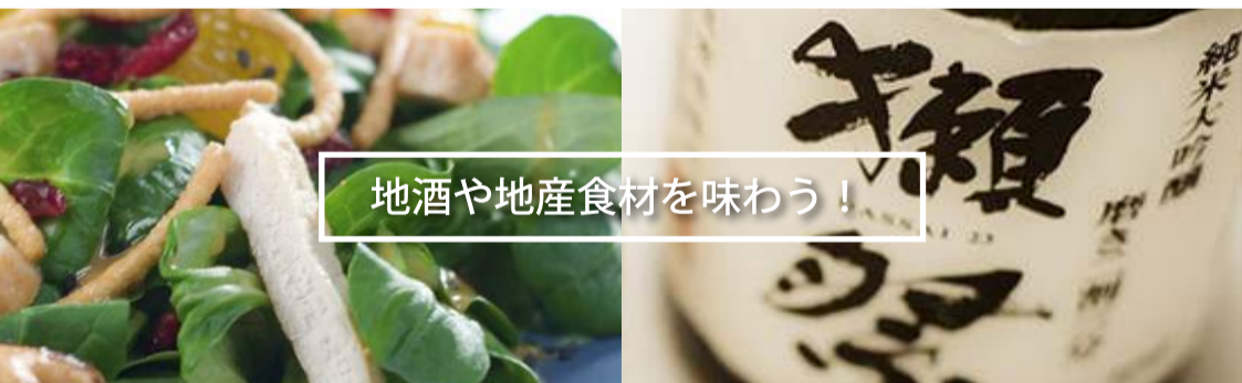
地酒や地産食材を味わう！