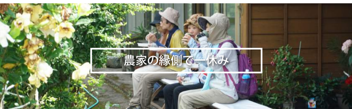
農家の縁側で一休み

その土地を巡りながら、豊かな自然や景色、地産食材を使った料理や地酒を楽しみ、温泉地が持つ「食」と「文化」の魅力を体感できるウォーキングイベント。今回は、俵山地区で約9 kmのコースを歩きます。