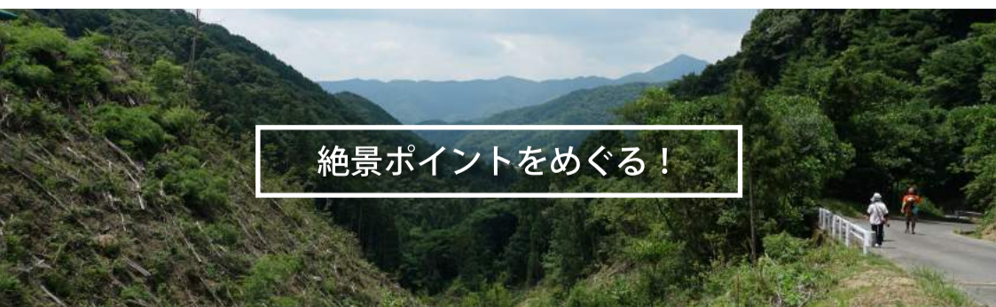
絶景ポイントをめぐる！